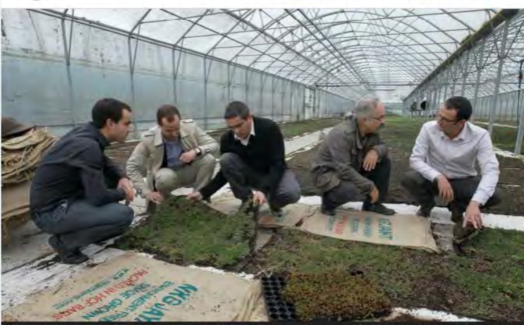
BIOTOP, UN PROJET ROCHELAIS QUI REDONNE VIE AUX DÉCHETS